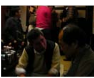
市長に詰め寄る? Hさん