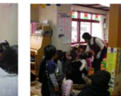
オルゴールの音に耳をかたむけず