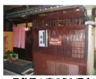
一見敷居の高そうな澤食さんの外観ですが...

事前に10人の方から参加申し込みがあったのですが、活性化部会で個別に声かけを行っていた効果か(?)、最終的に30人くらいのメンバーが参加してくださいました。いろんな話ができて、賑やかに文字どおり懇親することができました。門川市長も飛び入り参加されて、鍼灸師のツボ押しを体験、澤食の女将さんとのハグなど楽しんでおられました。これからも定例会議の終了後毎回懇親会を予定しておりますので、ふるって参加してください。確実に人の輪が広がりますよ。(村木)