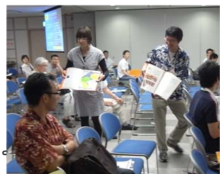
ポートフォリオの見本を公開するモデルGメンバー

モデルGは6月の全体会議で、第3期で明らかにする100人委員会モデルについて「個人」レベルのもの、「プロジェクト・チーム」レベルのもの、2つの視点でまとめる方針を示した。 個人の視点については「ポートフォリオ」によって、個人が社会・他者(チーム・メンバー)にどれだけ貢献できたか、自分へどれだけ貢献(学び、成長)できたかをまとめ、それを100人分集めることに