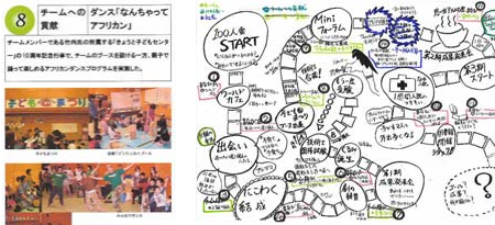
ポートフォリオ作成例(ポートフォリオサンプルより)