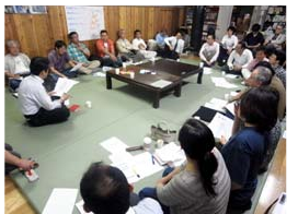
議論まとめの様子

全体Gでは5月の全体会議でワークショップ、6月には有志を交えて4回の打ち合わせを行い、全体行動のコンセプト案・運営組織案を議論した。 その結果、コンセプトとしては、「京都のまちづくりに関心のある人たちが語り合う日」(全員行動!...気が付けば全体行動!!やっぱり100人委員会って、おもしろい集まりやなあ〜。) キーワード: 伝える/つながる/引き出し合う/100人委員会モデル/活動層・関心層の巻き込み/絆と、まとまりました。