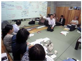
激論が交わされた

全体Gでは5月の全体会議でワークショップ、6月には有志を交えて4回の打ち合わせを行い、全体行動のコンセプト案・運営組織案を議論した。 その結果、コンセプトとしては、「京都のまちづくりに関心のある人たちが語り合う日」(全員行動!...気が付けば全体行動!!やっぱり100人委員会って、おもしろい集まりやなあ〜。) キーワード: 伝える/つながる/引き出し合う/100人委員会モデル/活動層・関心層の巻き込み/絆と、まとまりました。