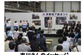
吉川さんのメッセージ