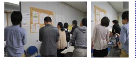
定例会議のプラ(+ )コメコーナーの様子

プラ(+ )コメのコメントより～ (1)「見かけ」重視のコメントが多い (2)記載内容に付いての判断まで「使用時の実感」を持っていない (3)「文字が多い」と「情報量が少ない」のコメントがあるということが読み取れた。