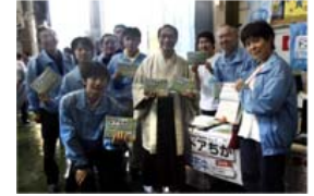
メンバーで記念撮影

我らのりものチームが丹精こめて作り上げてきた地下鉄便利マップ「ドアちか」。ついに試作版が完成し、5月29日の京都市営地下鉄30周年を記念する地下鉄祭りでも、市民のみなさんに配布することになりました。 あいにく当日は朝から警報が発令されるほどの雨。ぎりぎりまで開催が危ぶまれましたが、いざ会場の竹田車両基地に着くと、マイカメラや三脚を大事に抱える鉄道ファンが、傘や雨合羽姿で長蛇の列をなしています。雨にも風にも負けない濃い鉄分(=鉄道への愛)を目の当たりにし、がぜんチームの士気もアップ。会場一番奥にある整備場を利用したステージエリアにブースを設置し、ステージに入られるお客様に一冊ずつドアちかを渡していきます。子連れのご家族から年配の方まで幅広い客層のため、ドアちかへの反応もさまざま。「一つください」と声をかけられるひとや、「こんなの欲しかったんだよ」という嬉しい声に思わず話が弾む一面も見られました。