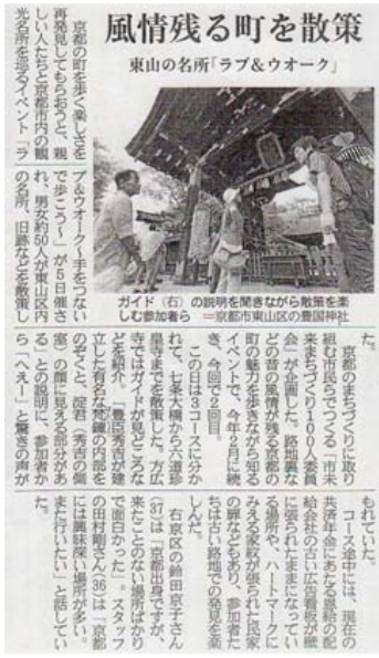
当日の様子が産経新聞(6/6朝刊)に掲載されました。