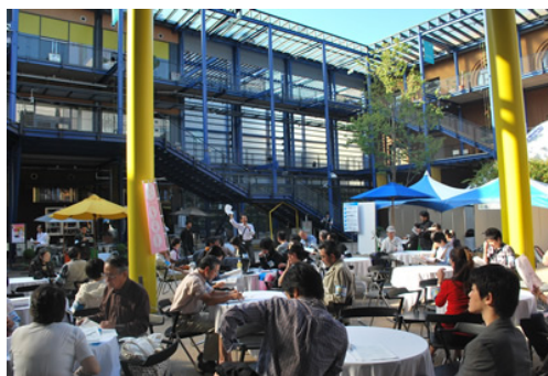
朝の打ち合わせ風景

委員会の皆様、京都未来まつり、は大変おつかれさまでした。統括にあたりましたモデル形成部会のメンバーを代表して皆様の努力に敬意を表すとともに運営に対するご協力に感謝申し上げます。当日は行き届かないこともございましたが各部会、プロジェクトチーム等の周到な準備と的確な判断で見事な仕上がりをご披露いただきました。この成功には多くの関係者のご協力、ご尽力がございましたことをあらためて委員の皆様にもご披露しておきたいと思っております。この成功を踏まえ、今後とも京都市における市民参加の推進のため各委員が様々な分野、地域でご活躍いただけるものと確信しております。皆さん、この勢いで12月の成果発表会に流れ込みましょう！