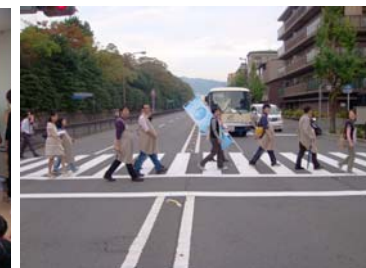
これぞリアルアビーロード?!