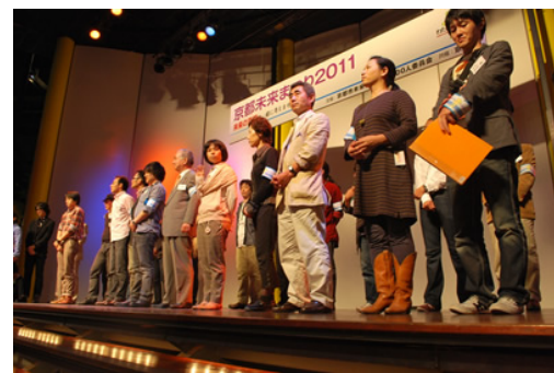
クロージング。みんな心なしか誇らしげ？